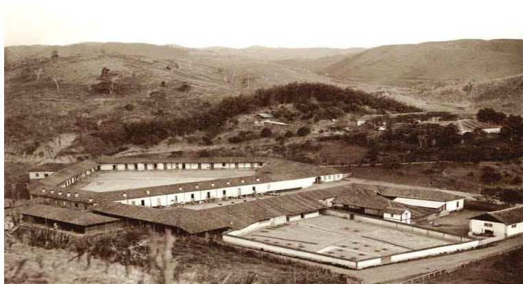
Fazenda Santo Antônio do Paiol. Antiga propriedade dos herdeiros de Manoel Antônio Esteves. Somente parte do conjunto resistiu ao tempo. Marc Ferrez. Coleção Gilberto Ferrez. IMS

No cerne desse contexto, o café enriquece Valença, transformando as áreas isoladas em fazendas prósperas com seus solares rurais e uma aristocracia agrária que influencia a cultura na terra fluminense. Sustentando a estrutura agrária descrita um grande número de braços escravos é utilizado, dado a ausência de maquinário nas lavouras cafeeiras da região.